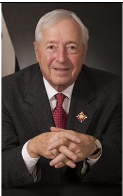
L'hon. J. Michel Doyon, Lt-gouverneur du Québec

Les municipalités, les organismes et les individus ont jusqu'au 1 er février 2022 pour soumettre une candidature. La Médaille du Lieutenant-gouverneur a pour objet de reconnaître l'engagement bénévole, la détermination et le dépassement de soi par des Québécois et des Québécoises qui exercent ou qui ont exercé une influence positive au sein de leur communauté ou de la nation québécoise.