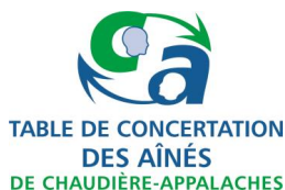
Table de concertation des aînés de Chaudière-Appalaches 5501, rue Saint-Georges, Lévis (Québec) G6V 4M7

Production et diffusion : Maurice Grégoire