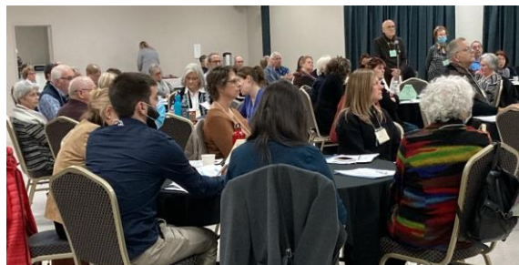
TCA-CA, Congrès « La Table en action » 17-11-2022 à St-Henri.